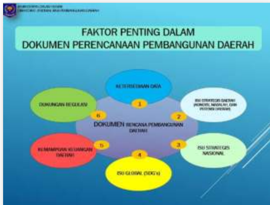
Gambar 2. SIPD dalam Dokumen Perencanaan Pembangunan