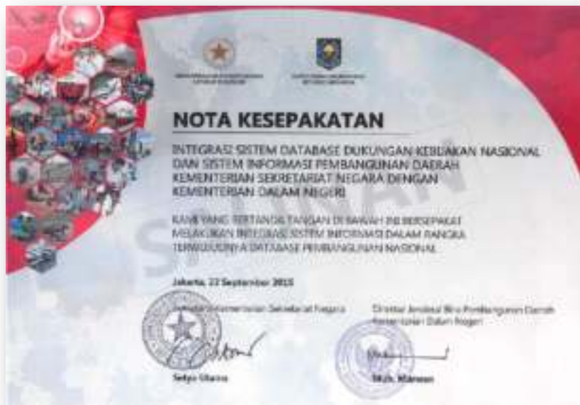
Gambar 10. Nota Kesepakatan antar Kementerian Sekretaris Negara dan Kementerian Dalam Negeri

Usaha yang telah dilakukan saat ini dengan LEMHANAS antara lain