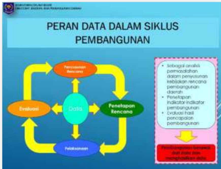
Gambar 1. Peran Data dalam Siklus Pembangunan

Dalam Negeri Nomor 70 Tahun 2019 tentang Sistem Informasi Pemerintahan Daerah (SIPD) yang menjadi pedoman bagi pemerintah dalam pelaksanaannya.