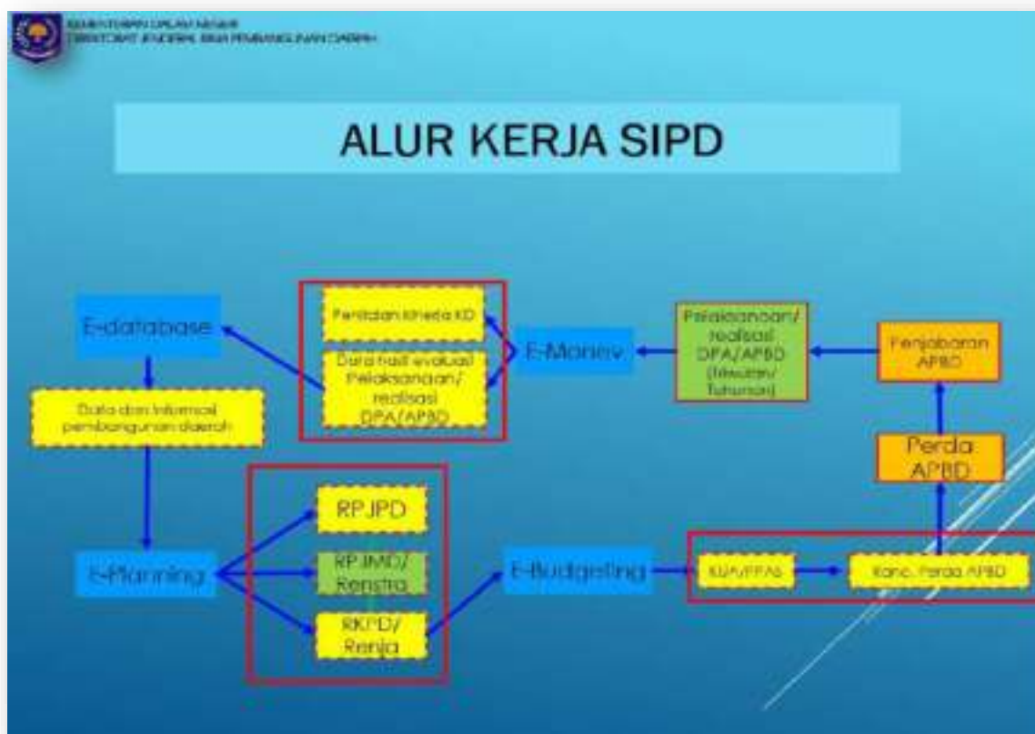
Gambar 6. Bagan Alur Kerja SIPD