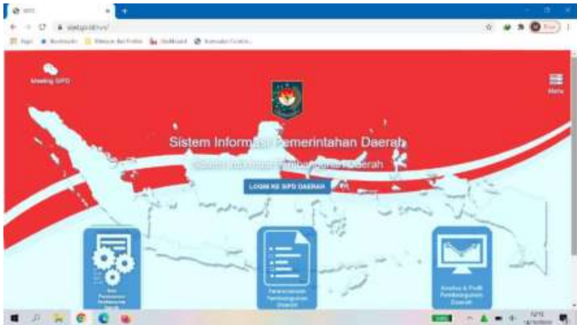
Gambar 3. Aplikasi SIPD

Berdasarkan Permendagri Nomor 70 Tahun 2019 tentang Sistem Informasi Pemerintahan Daerah selanjutnya disingkat SIPD adalah suatu sistem yang mendokumentasikan, mengadministrasikan, serta mengolah data pembangunan daerah menjadi informasi yang disajikan kepada masyarakat dan bahan pengambilan keputusan dalam rangka perencanaan, pelaksanaan, evaluasi kinerja pemerintah daerah.