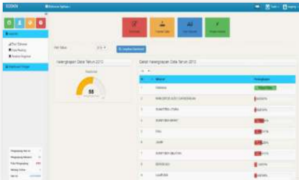
Gambar 8. Website SDDKN

Tujuan dari pengembangan Sistem DataBase Dukungan Kebijakan Nasional SDDKN adalah menyediakan data dan informasi dalam mendukung proses pengambilan keputusan oleh para pimpinan nasional dan daerah, Mengkomunikasikan data dan informasi dari daerah ke pusat dan sebaliknya melalui jaringan komunikasi data dan Data dan informasi yang dihasilkan diharapkan dapat memberikan dan mendapatkan gambaran yang terkini dari pelaksanaan program-program pembangunan di seluruh Indonesia. Aplikasi SDDKN dapat diakses melalui mesin pencari diinternet dengan alamat http://sddkn.setneg.go.id . Apabila kita berhasil mengakses aplikasi SDDKN maka akan tampil Dashboard SDDKN sebagaimana dapat dilihat seperti dibawah ini :