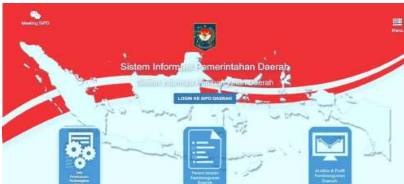
Gambar 5. Tampilan web site SIPD (tahun 2020)